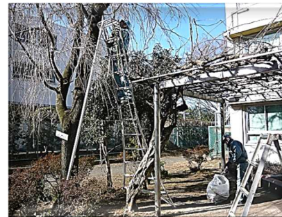
いつもお仕事ありがとうございます！

* 2学期からの取組で1月23日現在102枚のありがとうが寄せられています。 北校舎のパソコンルーム手前のボードにはり出されています。