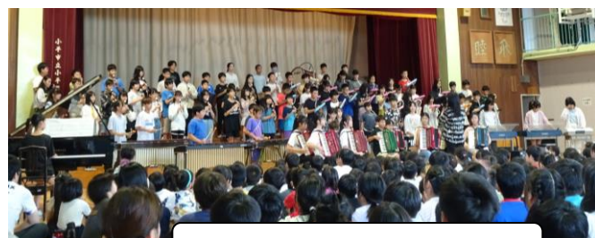
6年生「だれもがかかわり合えるように」