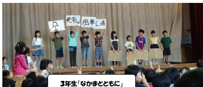
3年生「なかまとともに」