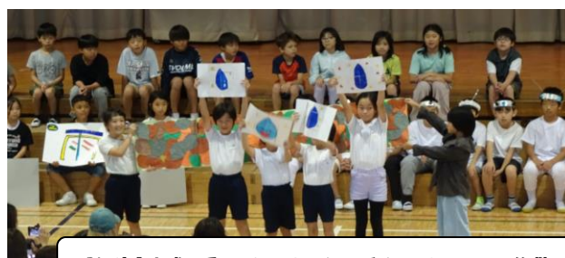
4年生「地球に乗ってどこまでも～ほくのわたしのエコ作戦～」