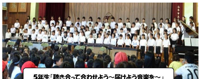
5年生「聴き合って合わせよう～届けよう音楽を～」