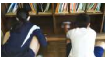
ロッカーの中を拭き掃除