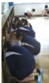
床の目地をキレイに