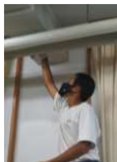
エアコンの管の上、窓枠もしっかり磨きました