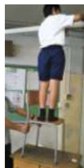
スクリーンの上も拭きました