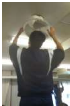
扇風機のカバーを外して羽を水洗い