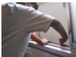
窓のレールは特に汚れがひどい