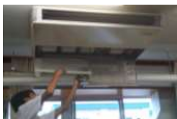
エアコンのパネルも開けました