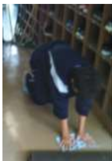
昇降口の床を雑巾がけ

生徒からは「みんなで協力して掃除ができた」「トイレの細かいところが大変だったが、キレイになって良かった」「細かいところまで掃除するにはもう少し時間があったらいいのに…」などの声があり、また一つ成長した六中生の姿を見ることができました。