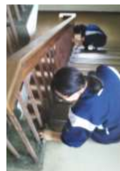
階段の手すりも丁寧に