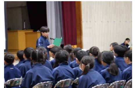
1年生によるお礼の言葉