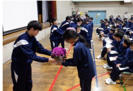
上級生からお花の贈呈