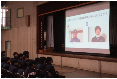
バレーが得意なのはどちら