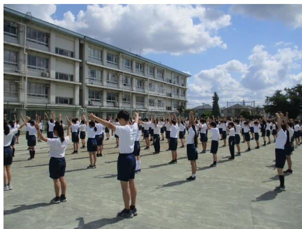
指先まで意識したラジオ体操