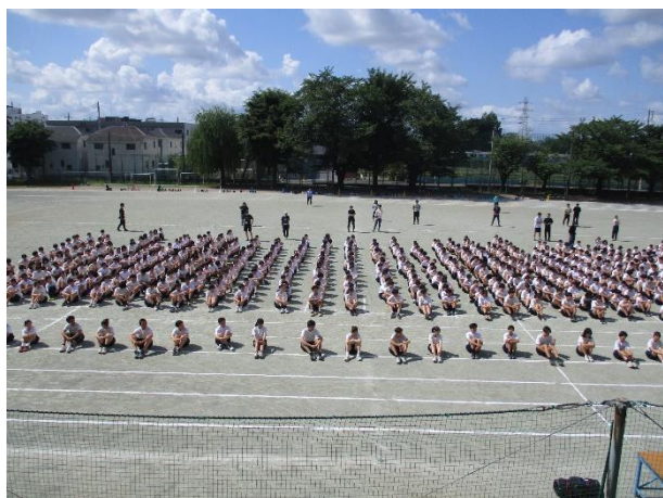
運動会の全校練習

1(月)全校朝礼 2(火)体カテスト 3(水)各種委員会、中央委員会 4(木)歯科検診(2年 ABC 組と3年生) 5(金)教育実習終 8(月)生徒朝礼 9(火)⑤⑥3年生進路説明会 10(水)小・中連携の日 11(木)歯科検診(1年生と2年 DE 組)