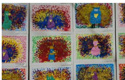
1年生「たまごから生まれた ハンドメイド Bird」