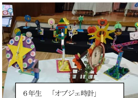
6年生 「オブジェ時計」