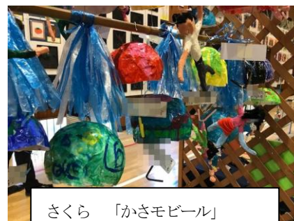
さくら 「かきモビール」