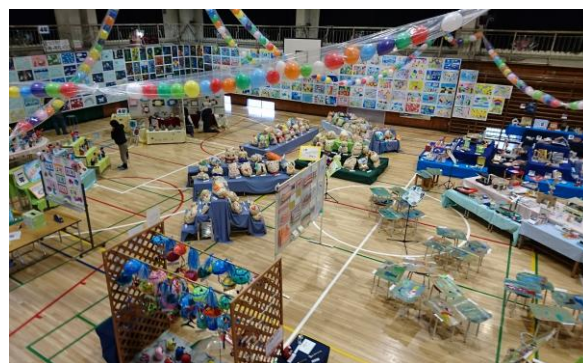
体育館全体の様子

これからも、子どもたちが自分の思いや考えを表現できる力を身に付けられるよう指導していきます。