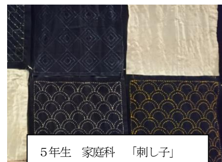
5年生 家庭科 「刺し子」