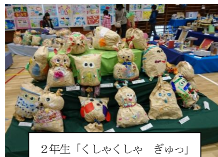
2年生「くしゃくしゃ ぎゅつ」