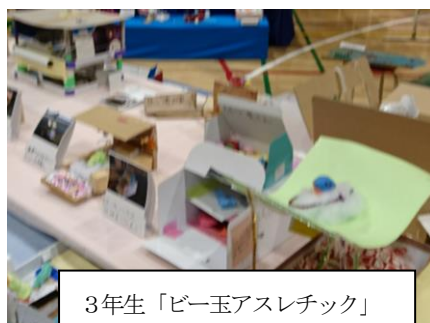
3年生「ビー玉アスレチック」