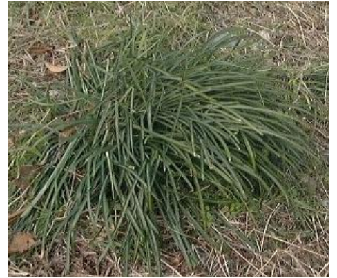
↑葉が茂った後の彼岸花

何気ない文書ですが、良く考えてみると、「赤いきれのように咲き続けているひがん花」はきつとごん(きつね)の視線は隠してしまうはず。花には茎があり、葉があり、その陰に隠れた小動物からは葬列がちらちら見えるはずは無いのです。今までの「花」「植物」の既有知識からはそう考えるのが当然です。「ちらちら見え始めました」に対して、葉が茂っているのになぜ?なぜ見えるの?と感じて欲しい場面です。しかし、この疑問は「本物の彼岸花」を見ると一瞬で解決されます。彼岸花には、葉が無いのです。茎しか無いため、「ちらちら」見えるのです。本物の彼岸花を見ないと分からないことです。でも、そこで「え?本当に葉はないの?」と思えたら、もっとすごい!そこで、こどもたちは調べたくなります。すると、彼岸花は球根から花が出てきて、その花が枯れた後で葉が成長することを知ることでしょう。そして「彼岸花以外でも、花が咲いた後に葉を付ける植物はないかな?」と思いを巡らすでしょう。その代表格、皆さんもすぐに思い起こしませんか?「日本と言えば」の花、「桜」です。では、なぜ、花が咲いた後に葉を茂らすのか…思いは尽きません。「本物」を見たから湧き出す好奇心です。もちろん、本物を見なくても物語は読めます。でも、本物の彼岸花を見たら、ごんぎつねの読み、情景描写(物語の風景)のイメージはぐっと深くなることでしょう。