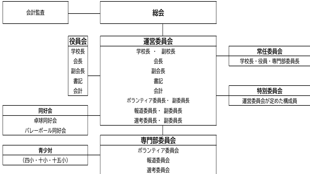
(図2) 【職務上の組織図】