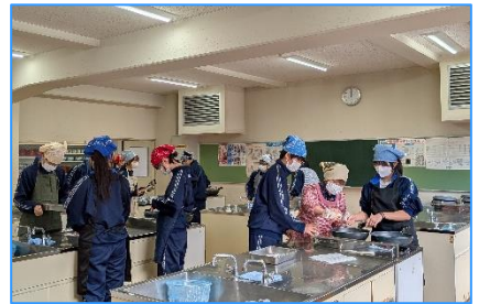
<家庭科の調理実習>