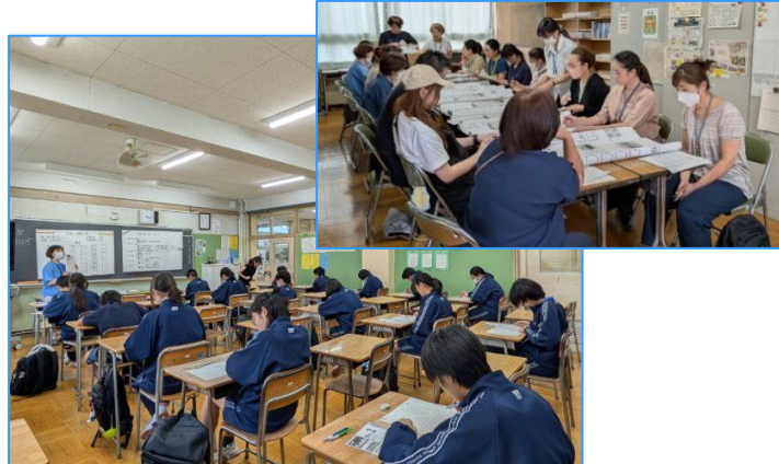
<実用英語技能検定>