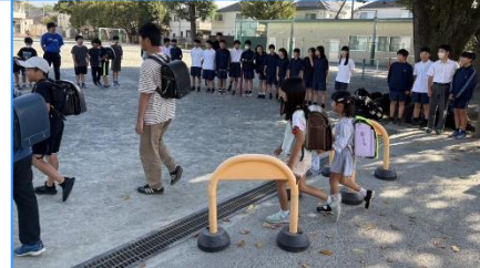
<あいさつウィーク>