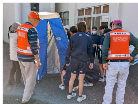
<地域合同総合防災訓練>