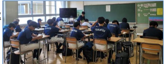
<夏休みの学習教室>