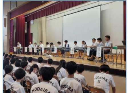
<道徳授業地区公開講座>