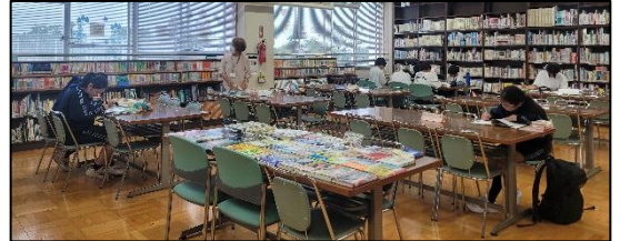
<定期考査前の放課後学習教室>