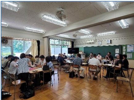
<創立60周年記念事業実行委員会>