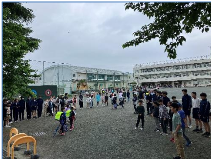
<あいさつウィーク>