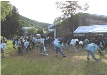
宿舎の前で朝の体操

間に日本が世界に誇る日光の世界遺産の歴史的建造物の荘厳さに触れることができました。日光や尾瀬の素晴らしい自然を存分に味わうとともに、宿舎で友達と一緒に食事をしたりお風呂に入ったり、部屋で思い思いに過ごしたりしたことは、こどもたちの心に残ったことでしょう。宿舎での生活では、友達を思いやり、みんなで協力しながら過ごす大切さを学ぶことができました。このように学校行事を通して見聞を広め、自然や文化に親しむとともに、互いを思いやり、協力するなどの人間関係を築きながら集団生活のあり方や公衆道徳などについての体験をすることが