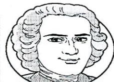
ジャン・ジャック・ルソー

ジャン=ジャック・ルソーは現在のスイスに生まれ、フランスで活躍した思想家です。人権や民主政治、教育など広汎なテーマの著書は、国境や時代をこえて人々に影響を与えました。童謡、「むすんでひらいて」の作曲者でもあります。