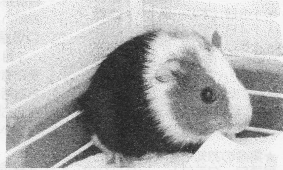
二小のモルモット。もうすぐ名前が付きます！