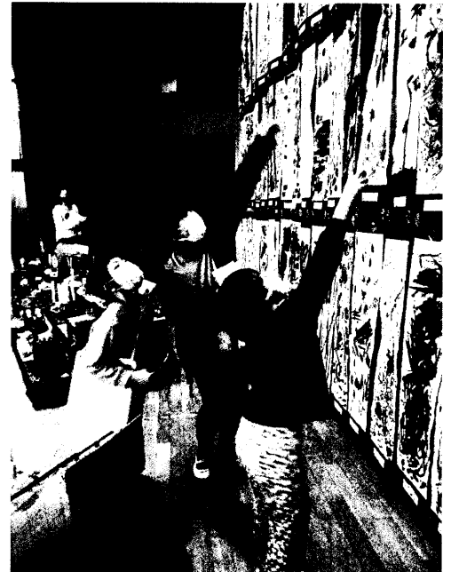
「墨で描いたんだよ。」「すご〜い!!」

今日から12月。学校は引き続き、子どもたちの心身の健康に留意しながら、2学期のまとめを行います。寒さが一段と増し、気忙しい年の瀬を迎えるときです。皆様、くれぐれもご自愛くださいませ。