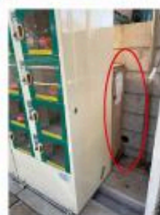
野菜販売機右横の隙間から取ってください。