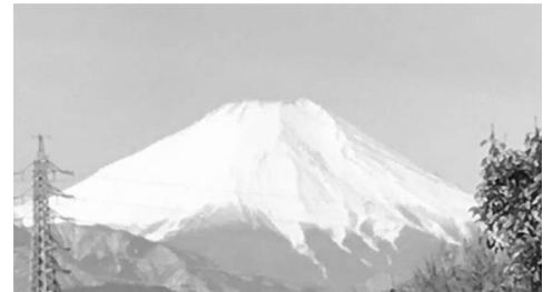
十四小の4階から望む富士山

さて、私は年末の全校朝会で、小型のドローンを飛ばしました。体育館を飛び回るドローンを見て、子どもたちは歓声を上げて喜んでくれました。その後、政府広報 Web ビデオ「Society5.0」を流しました。ドローンを使った宅配、献立案を教えてくれるAI冷蔵庫、天気予報を伝えてくれるAIスピーカー、家に居ながら医師の診療を受けられる遠隔診療、GPS機能を使って畑を耕す無人トラクター、時間帯を問わず目的地まで連れて行ってくれる自動走行バスの動画を子どもたちは真剣に見ていました。主人公である女の子が「未来が楽しみでしょ。」とカメラ目線で微笑むシーンで終わるビデオですが、私は間髪入れず、「その未来を創るのは君たちです。」と投げかけました。「こういった未来を創っていくことに必要なことは何か。特別なことはありません。毎日の授業をしっかり受けて、～中略～だから、2学期の学習のまとめをしっかりしましょう。」というのが話の概要です。その延長上にあった冬休みの宿題ですが、年末・年始のご多用の中ご協力いただきましたこと、感謝申し上げます。