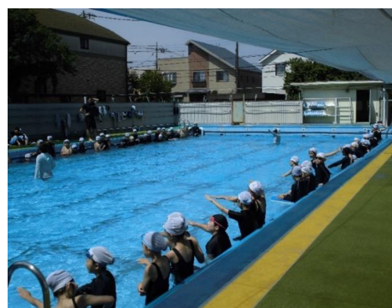
水泳指導中の高学年児童(学校ブログより)