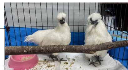
うこっけい 「こむぎ」と「みるく」

7月中旬、学校で大切に飼育していたうさぎのメロンちゃんが亡くなりました。生前このメロンちゃんの元には、多くの児童が集まり、高齢のうさぎを思いやりながら、そっと撫で、静かに話しかけるなど、その命の温もりを感じ、癒されている様子がしばしば見られました。今は、うこっけいの「こむぎ」と「みるく」がその役を担いこどもたちの心に寄り添っています。これからも限りある命と向き合いながら、友達と関わり、時に失敗をしながらも少しずつ成長していきます。保護者・地域の皆様には温かいご支援をいただきありがとうございました。心より感謝申し上げます。1年のよい締めくくりと、素晴らしい年を迎えられることを祈念いたします。