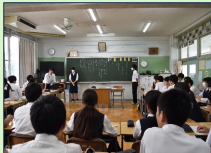
中学3年生の学級活動(話し合い活動)