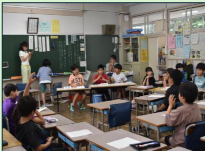
小学4年生の学級活動(話し合い活動)