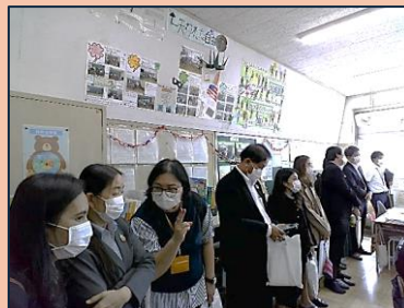
学級活動の授業を参観

令和7年9月29日(月) タイ王国の教育省職員等 が日本の「人格教育」を 学ぶために、小平第三小 学校及び上水中学校の 学級活動を視察しました。