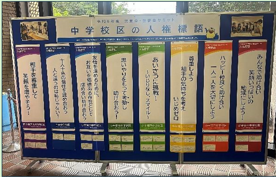
市役所1階ロビーにて掲示