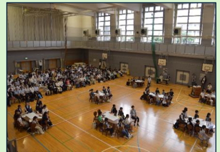
児童会・生徒会サミットの様子