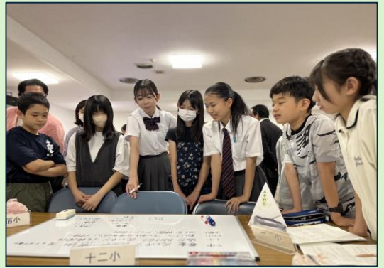
児童会・生徒会サミットの様子