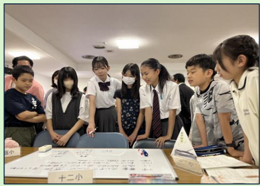
じどうかい・せいどかい ようす 児童会・生徒会サミットの様子

いごち がっきゅう 居心地のよい学級、 がっこう 学校、まちについて、 みんなが みんなで考えて、 と 取り組んだね!