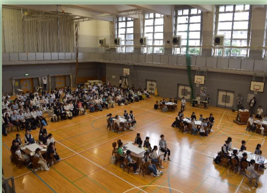
児童会・生徒会サミットの様子