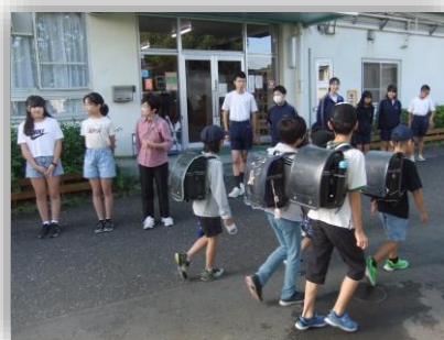
小・中学校合同あいさつ運動