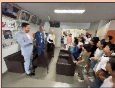
じどう こうりゅう 児童との交流

れいわ ねん がつ にち きん 令和6年7月19日(金) しちゅうこくれんぽう せんせい アラブ首長国連邦の先生 がた がっきゅうかつどう きゆう 方が「学級活動」、「給 しよく せいそうかつどう 食」、「清掃活動」などの ようす しさつ 様子を視察するため、小 がっこう およ じょうすい ちゅうがっこう 平第三小学校を訪問しま がっきゅうかつどう ほうもん した。