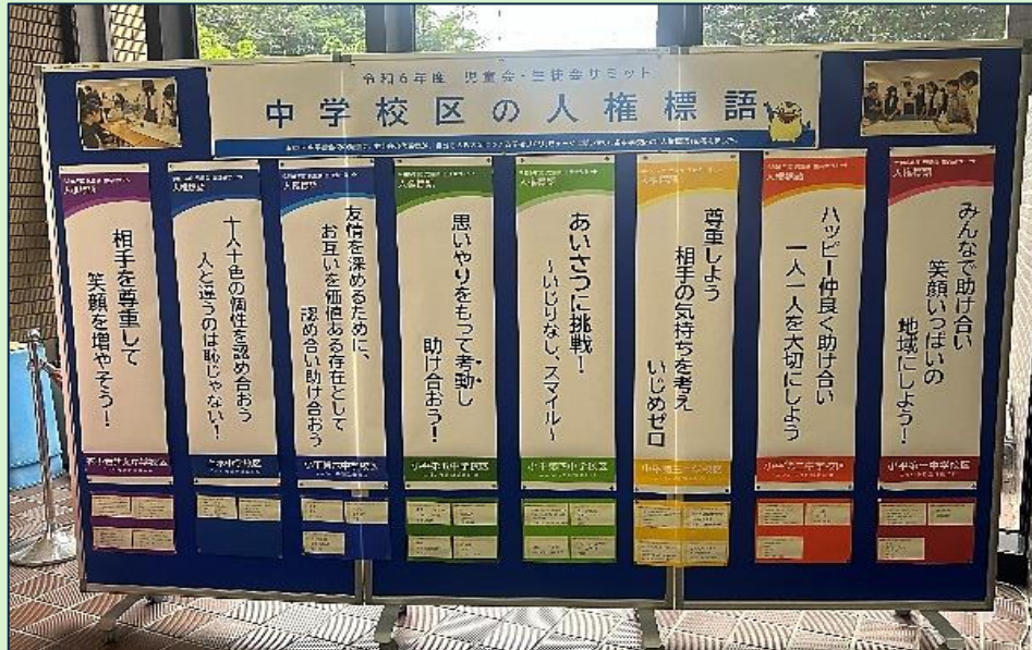
しやくしょ かい けいじ 市役所1階ロビーにて掲示