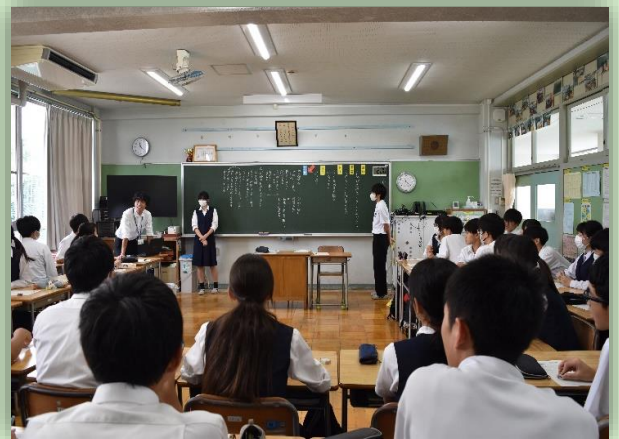
中学3年生の学級活動（話し合い活動）