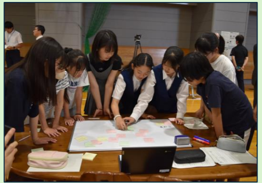
じどうかい・せいどかい ようす 児童会・生徒会サミットの様子