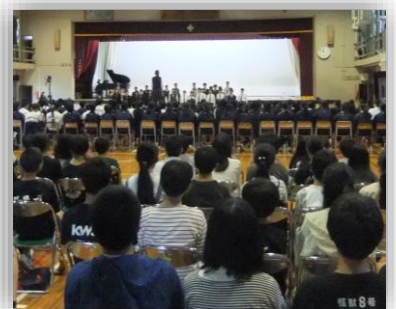
中学校の合唱コンクール リハーサルを小学生が見学