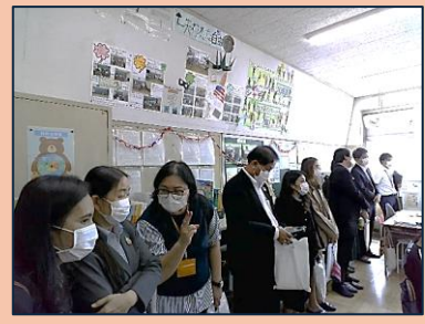
がっきゅうかつどう じゆぎょう せんかん 学級活動の授業を参観

れいわ ねん がつ にち げつ 令和7年9月29日(月) おうこく きょういくしやうしよくいんどう タイ王国の教育省職員等 がほん じんかくきょういく が日本の「人格教育」を まな こだいら だいせんしやう 学ぶために、小平第三小 がっこう およ じょうすい ちゅうがっこう 学校及び上水中学校の がっきゅうかつどう しさつ 学級活動を視察しました。