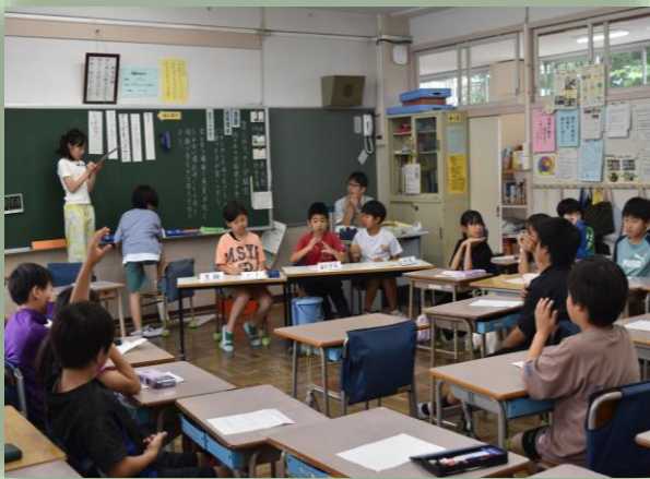
小学4年生の学級活動（話し合い活動）