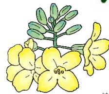
ブロッコリーの花