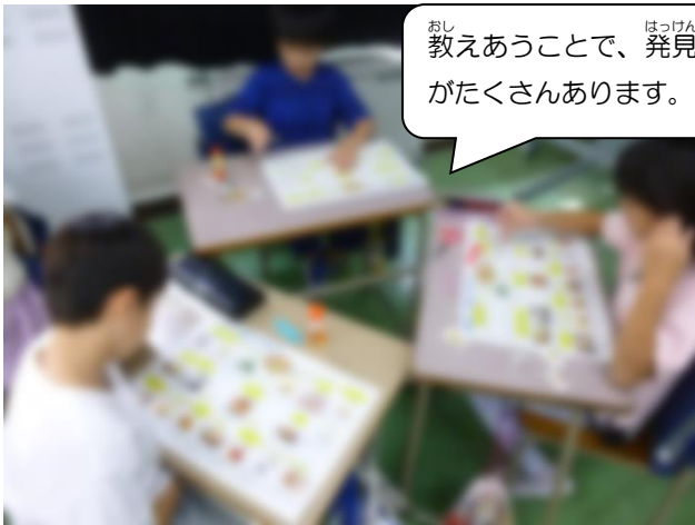
教えあうことで、発見がたくさんあります。

給食には大豆や大豆製品がたくさん使われていることを紹介しました。大豆の栄養の話をして、大豆が昔から日本人に愛されている食材であることを伝えました。国語「すがたをかえる大豆」と関連した授業で、3年生は大豆への興味関心が高まっています。大豆・大豆製品を使った給食がでると「これにも大豆が入っている!」と大反響です。