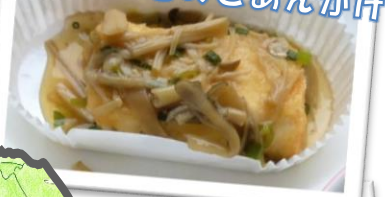
あげだし豆腐の どんまいきのこあんかけ

10月の給食では8種類の「食品ロス削減給食」を実施しました。それに合わせて、給食時間に「食べ物の大切さ」を伝える放送を行いました。小平市のキャラクター「はぐれたべものズ」が給食メニューとコラボレーションし、子どもたちの興味関心を高めました。給食時間で流した放送の一部は下のQRコードから見るすることができます。ぜひご家庭でもご覧ください。