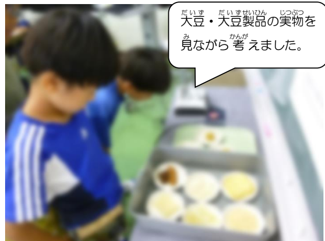
大豆・大豆製品の実物を見ながら考えました。