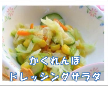
かくれんぼ ドレッシングサラダ