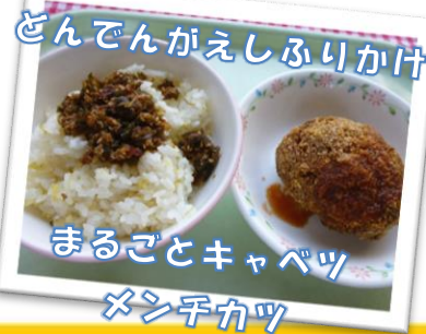
ざんでんがえしふりかけ まるごとキャベツ メンチカツ