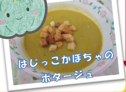
はじっこかぼちゃの ポタージュ