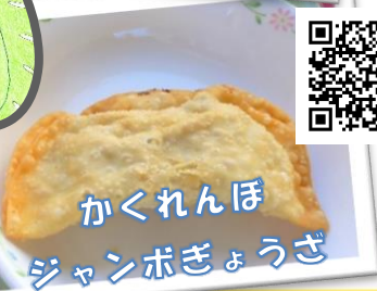
かくれんぼ ジャンボぎょうざ