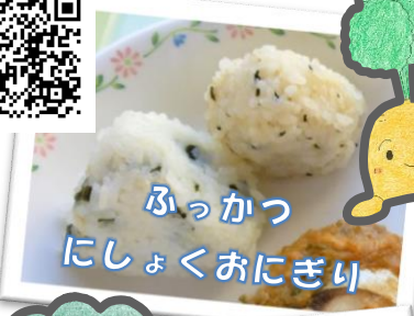
ぶっかつ にしょくおにぎり