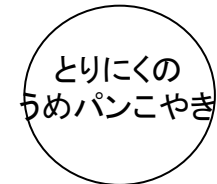
とりにくの うめパンこやき