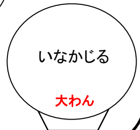
いなかじる 大わん