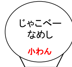
じゃこべー なめし 小わん