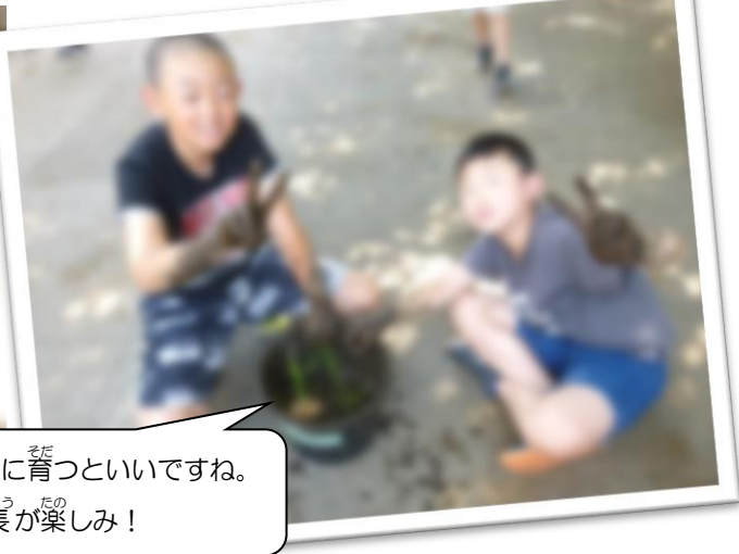
立派に育つといいですね。 成長が楽しみ！