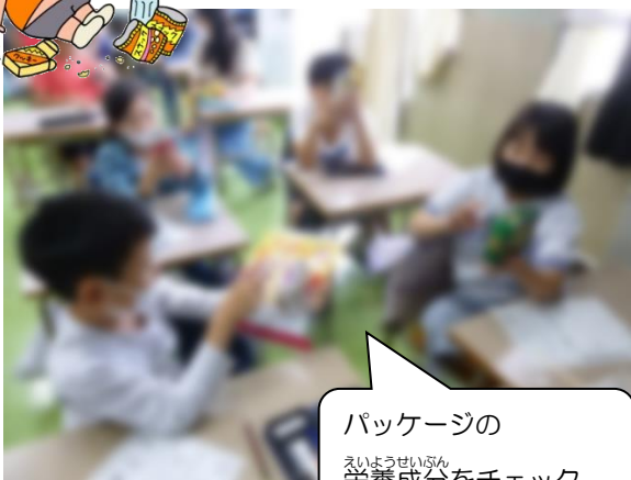
パッケージの 栄養成分をチェック。

5月26日（金）に4年生各クラスで、「間食について考えよう！」という授業を行いました。おやつ の 量 や 食べる時間 について 学習しました。実際にお菓子のパッケージの表示を見ながら、どれくらい食べられるのか計算しました。「賞味期限」「消費期限」の違いや、運動とエネルギー の関係 も学習しました。自分たちにとって身近なおやつ…「いつ」「なにを」「どれくらい」食べればよいか、学ぶことができました。