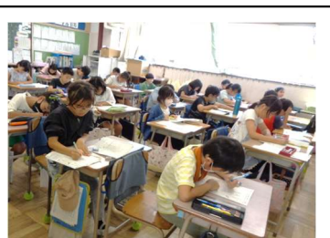
朝会の時間等に集中して書きました。

子ども達の作品を読んでいると、子ども達が、素直に自分の気持ちを伝えていて、この自然さというものは、非常にかげがえのないものだと思います。発想も、大人が忘れてしまっているような視点で世界を捉えていて、はっとさせられるものもありました。書けそうで書けなくて、でも一生懸命に書いた字のたたずまいが本当にぐっときます。ぜひ、ご家庭で一緒にお読みになっていただきたいです。(後日、控えをお子様に戻却します)