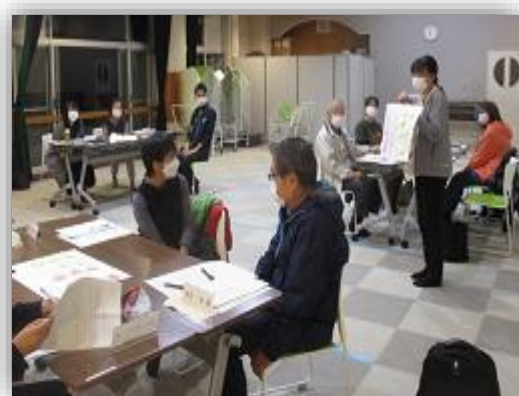
〈 熟 議 の 様 子 〉

今後も、令和3年度における学校経営協議会の重点目標である「熟議」によって「十小のよさと課題」を顕在化し、地域力を使って問題解決に繋げていきます。