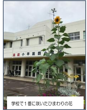
学校で1番に咲いたひまわりの花

このベスト3は、「四小スタンダード」の取組でもあります。御家庭でもぜひ実践を継続させてください。