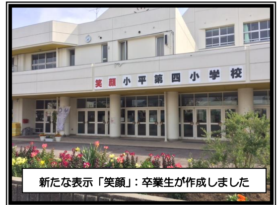
新たな表示「笑顔」：卒業生が作成しました

その他にも、地域の環境や人材を生かした特色ある教育活動を展開し、子どもの豊かな学びが充実できるよう努めています。最後になりますが、今年度も保護者や地域の皆様には、様々な面で御支援や御協力をいただくことがありますが、どうぞよろしくお祈りいたします。